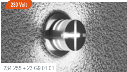
234 255 + 23 G9 01 01