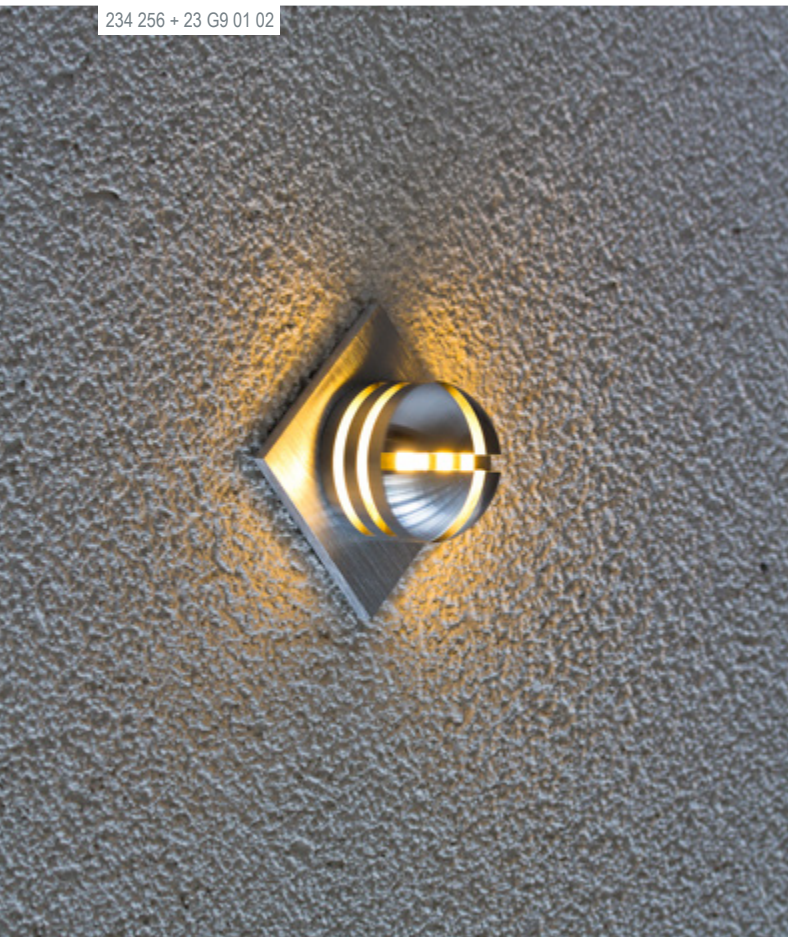
234 256 + 23 G9 01 02